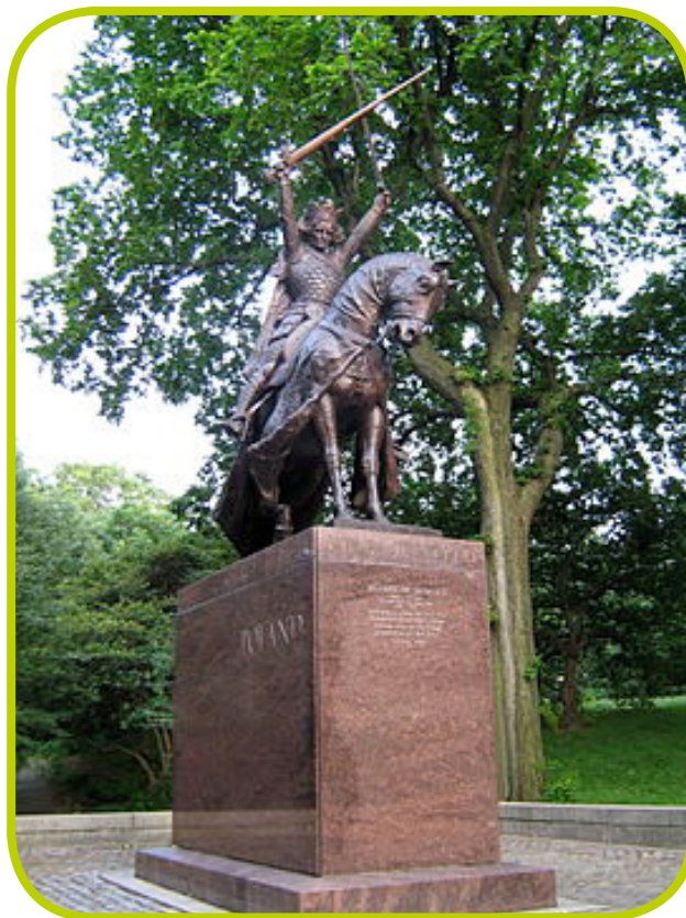
Pomnik Władysława Jagiełły w Nowym Jorku.

W 1386 roku, zimą, posłano po litewskiego księcia. Przyjechał on do Polski razem ze swoim orszakiem. Po przybyciu został ochrzczony w Krakowie. Podczas ceremonii otrzymał imię Władysław. Ślub z Jadwigą odbył się sześć dni później, 21 lutego. Wesele młodej pary trwało kilka dni. Jagiełło zostając mężem Jadwigi, stał się też królem Polski – Władysławem II Jagiełłą. Jego koronacja odbyła się 4 marca w wawelskiej katedrze.