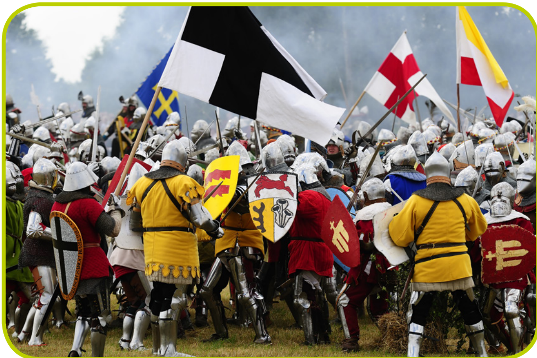
Rekonstrukcja bitwy pod Grunwaldem.

Bitwa trwała ponad sześć godzin. Skończyła się zwycięstwem wojsk polsko-litewskich. Około godziny 19 na polach Grunwaldu zostali tylko Polacy i Litwini. W dzień po bitwie, 16 lipca, odnaleziono ciało wielkiego mistrza. Władysław Jagiełło kazał z godnością odesłać je do Malborka. Tam dowódca krzyżacki został pochowany.