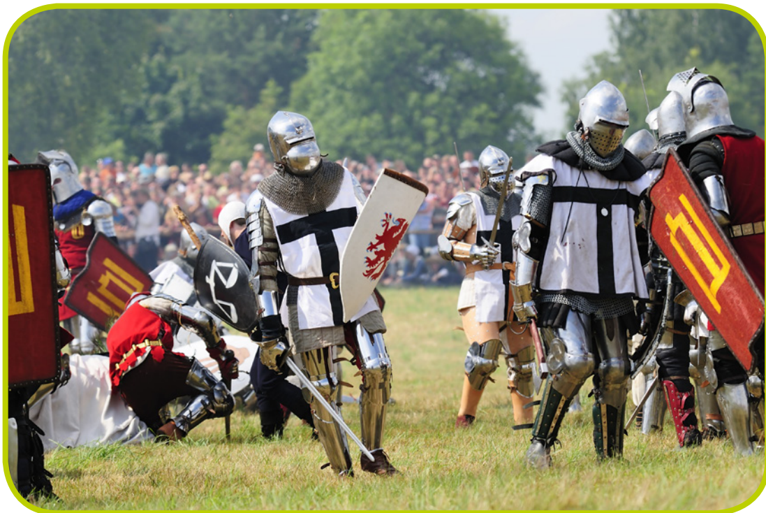
Rekonstrukcja bitwy pod Grunwaldem.

Przed bitwą odbyła się msza polowa, po której dowódcy ustalili zawołania bojowe. Wybrano nazwy dwóch miast – polskiego i litewskiego. Były to Kraków i Wilno. Kolejnym krokiem króla Władysława Jagiełły było tradycyjne pasowanie na rycerzy. W tym momencie giermkowie, po złożeniu przysięgi, zostawali rycerzami. Krzyżakom czas się dłużył. Niecierpliwili się.