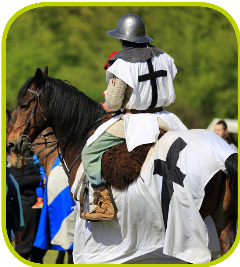
Krzyżak. Rekonstrukcja bitwy pod Grunwaldem.

Małżeństwo Jadwigi i Władysława było porozumieniem dwóch państw: Polski i Litwy. Ich głównym celem było pokonanie Krzyżaków – tak nazywano rycerzy Zakonu. Nosili oni długie białe płaszcze z czarnymi krzyżami. Jeździli na koniach. Wielki mistrz Zakonu nie chciał zaakceptować nowego polskiego króla.