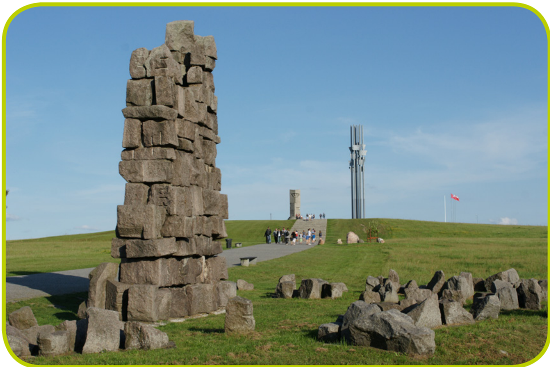
Pomnik upamiętniający bitwę pod Grunwaldem.

Do planowanego spotkania wojsk krzyżackich z przeciwnikami doszło w 1410 roku. W upalny letni dzień, 15 lipca, stanęli naprzeciwko siebie Krzyżacy, Polacy i Litwini. Na rozległe pola w okolicy wsi Grunwald przybyli rycerze razem ze swoimi giermkami. Wojska Jagiełły i Witolda zatrzymały się w lesie, a wojska wielkiego mistrza na otwartym polu.