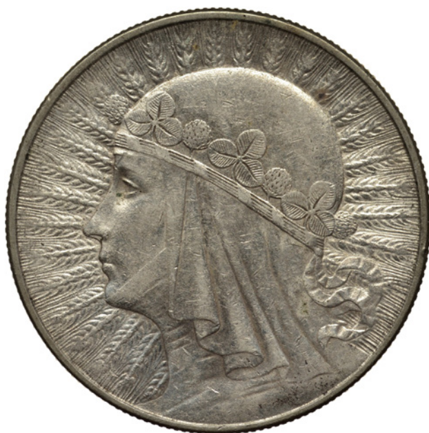
Wizerunek królowej Jadwigi na monecie z 1932 roku.

Jadwiga urodziła się w 1373 roku na Węgrzech. W tym czasie jej ojciec, król Węgier Ludwik był także królem Polski. Dlatego królowna miała prawo do polskiego tronu. Tak też się stało 15 października 1384 roku, kiedy to jedenastoletnia dziewczynka została koronowana. Otrzymała tytuł króla Polski, mimo że nie była mężczyzną.