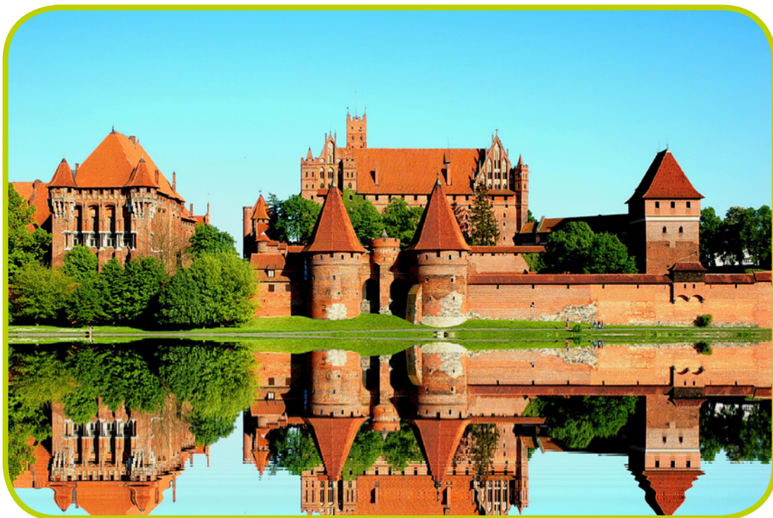
Zamek krzyżacki w Malborku.

Stolicą państwa krzyżackiego był Malbork. W olbrzymim zamku mieszkał wielki mistrz oraz rycerze. Za panowania Jagiełły Zakonem dowodził Ulrich von Jungingen, który zdecydował się na wojnę z Polską oraz Litwą. Zakon marzył, aby być najsilniejszym państwem w tej części Europy. Polacy i Litwini nie byli z tego zadowoleni. Podjęli decyzję o wojnie.