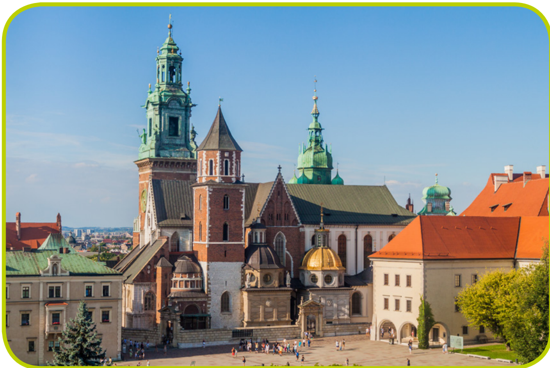
Wawel. Zamek królewski w Krakowie.

Młodziutka Jadwiga nie mogła sama rządzić na Wawelu. Zaczęto szukać dla niej odpowiedniego męża. Kandydatów do ręki królowej było wielu. Ostatecznie wybrano wielkiego księcia litewskiego Jagiełłę, władcę kraju sąsiadującego na wschodzie z Polską.