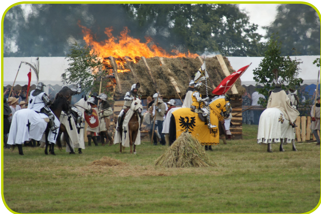
Wojska krzyżackie palą chłopskie chaty. Rekonstrukcja bitwy pod Grunwaldem.

Za panowania Jadwigi i Władysława Polska nie ze wszystkimi sąsiadami żyła w zgodzie. Oczywiście najlepiej układało się Polsce z Litwą. Niestety najwięcej problemów sprawiali sąsiedzi na północy – Zakon krzyżacki, który był też groźny dla Litwy. Rycerze z północy napadali na polskie oraz litewskie ziemie. Niszczyli gospodarstwa, a ich mieszkańców okradali.