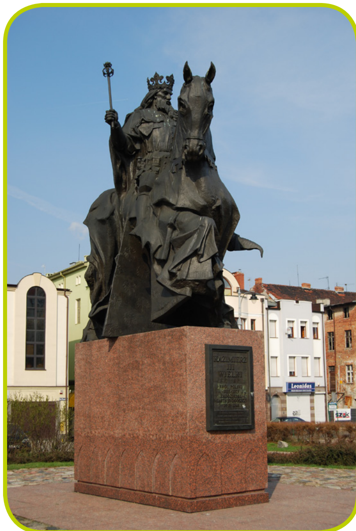
Pomnik Kazimierza Wielkiego w Bydgoszczy.

Kazimierz Wielki był ostatnim królem z dynastii Piastów, której początek dał Mieszko I. Po śmierci Kazimierza rozpoczęły się czasy nowej dynastii Andegawenów. To właśnie z tej rodziny pochodziła królowna Jadwiga, która później, po swojej śmierci, została ogłoszona świętą.