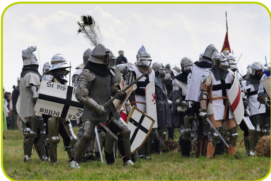
Rekonstrukcja bitwy pod Grunwaldem.

Do dziś nie wiadomo, ilu rycerzy tego dnia walczyło pod Grunwaldem. Wiemy, że siły polskie były większe od wojsk zakonnych. Król Polski był dobrym dowódcą, ponieważ jego wojska czekały na bitwę w lesie, gdzie drzewa dawały cień i chłód. Krzyżacy czekali dumnie godzinami na walkę w upale.